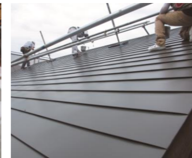
竣工当時の色がよみがえった屋根などで埋めます