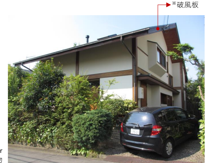
After 美しくさらに風合いを増した建物