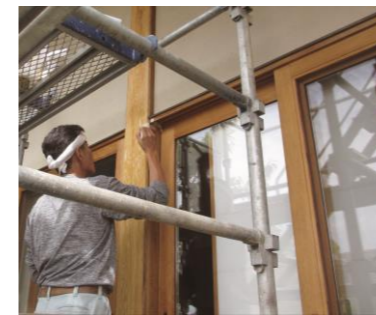
乾燥してできた隙間はコーキング

ご自宅の状態について気にかかることがある方は、ぜひ東京本部・大阪本部へお問い合わせください。